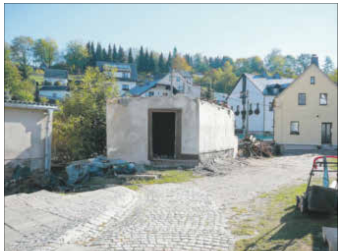
Am 5. Oktober 2018 wurde das sogenannte „Hitler-Hais'l“ abgerissen.