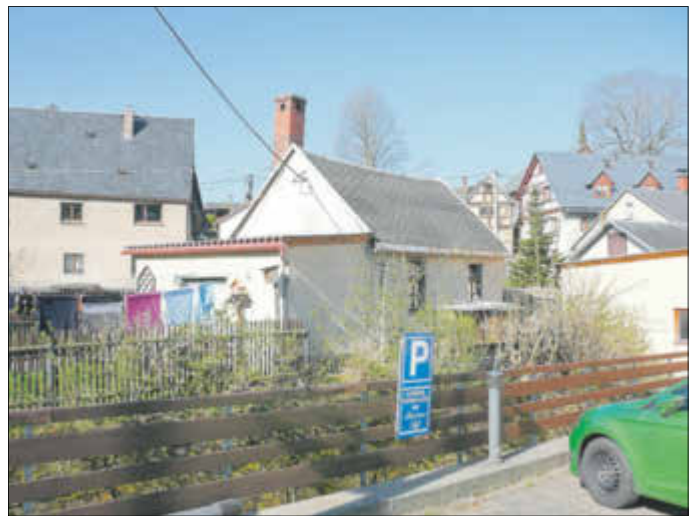
Das Hais'l im April 2018.