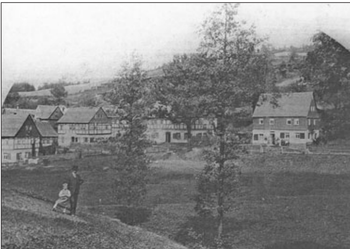
Alte Aufnahme aus der Zeit, als es die Bahnhofstraße und einen großen Teil der heutigen Bebauung noch nicht gab. Ganz links im Bild das Schott-Haus und davor das Schott-Bergel.