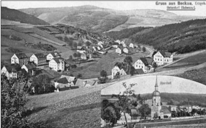
Alte Ansichtskarte (eigene Sammlung).

Ein etwas seltsamer Name für einen Bockauer Ortsteil ist der „Schwanz“. Früher war diese Bezeichnung häufig anzutreffen und das Unterdorf wurde sogar auf einer alten Postkarte so bezeichnet.