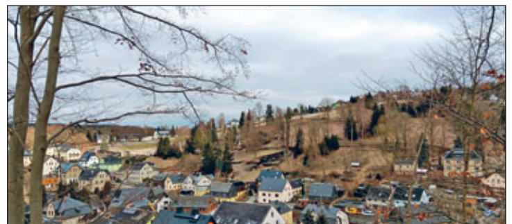
2026 – Blick zu den Reuther-Stufen.