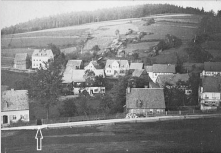
Das Gässchen im Jahr 1904 noch ohne die Bäckerei Roth.