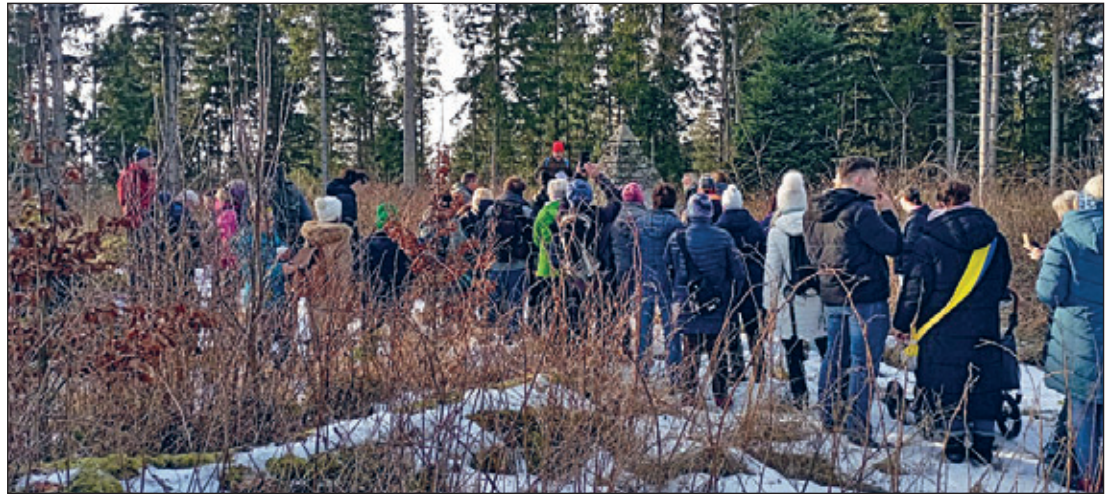
...auf dem Buchberg

Wie jedes Jahr machten wir im Januar eine Wanderung. Diesmal galt es unseren Hausberg „Buchberg“ zu bezwingen.