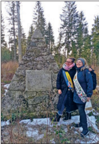
Vogelbeerkönigin und Wurzelkönigin am Gedenkstein Richter